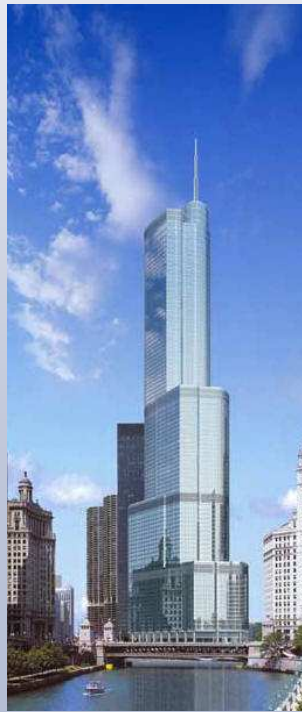
Trump Tower – Chicago - USA