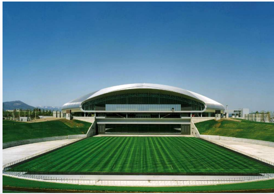
Sapporo Dome – Sapporo - Japan