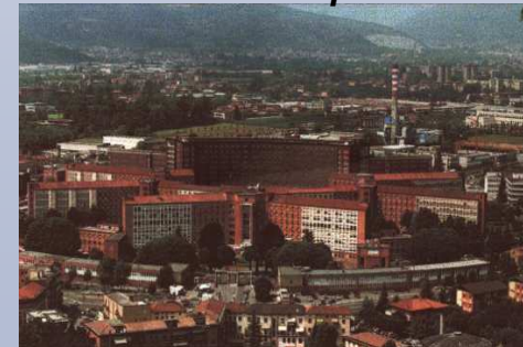
Ospedali Civili – Brescia - Italy