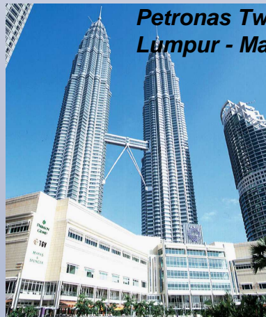
Petronas Twin Towers – Kuala Lumpur - Malaysia