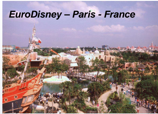
EuroDisney – Paris - France