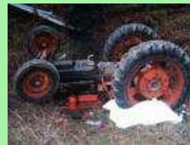
Infortunio mortale in agricoltura

Obiettivo Specifico 2.2: Commercio macchine usate e nuove: adeguamento a norma giuridica e tecnica. Informazione e controllo venditori di macchine agricole Promozione rottamazione dell’usato non adeguabile.