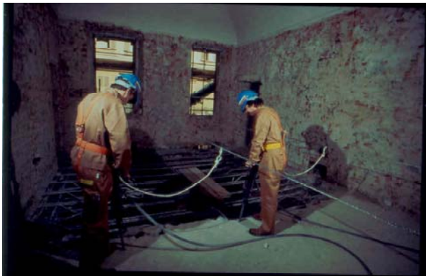
Demolizione di un solaio in cemento armato

Le strutture metalliche vengono demolite con procedimenti inversi alla loro costruzione. Gli elementi della struttura vengono rimossi con l'ausilio del cannelo ossiacetilenico, del flessibile ed attrezzi manuali. Gli elementi opportunamente imbracati vengono trasportati a terra per mezzo di un apparecchio di sollevamento.