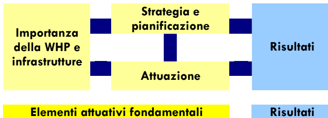
Fig. 3: Criteri di buona pratica per il livello di intermediazione

I progetti a livello di intermediazione contribuiscono allo sviluppo di strutture di sostegno, ad esempio, nella forma di reti locali o regionali, oppure di progetti di cooperazione a cui partecipano strutture di servizi e di auto-amministrazione pertinenti alle PMI. I criteri per il livello di intermediazione vengono suddivisi in quattro categorie, tre delle quali formano la base di una struttura di sostegno finalizzata alla promozione della salute a livello di intermediazione. La quarta categoria interessa i risultati di progetto (si faccia riferimento alla Fig. 3).