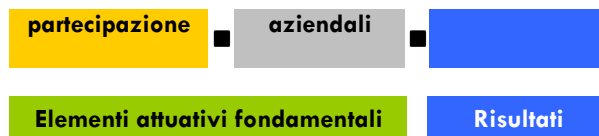
Fig. 2: Criteri di buona pratica per la WHP nelle PMI

Nella realtà pratica è possibile trovare esempi concreti relativi a tutte e tre le categorie. Particolare rilievo viene attribuito all'ultima categoria in termini di sostenibilità e di erogazione di servizi efficaci.